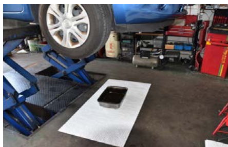
オイル交換時使用例