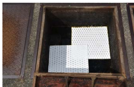
油水分離層使用例