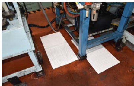
機械の漏油の吸着処理

※弊社の実測値になります。実際の吸着量と異なる場合があります。 ※測定方法は、型式認証による試験方法となります。