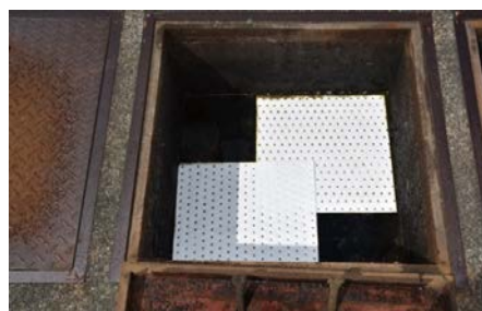
油水分離層使用例